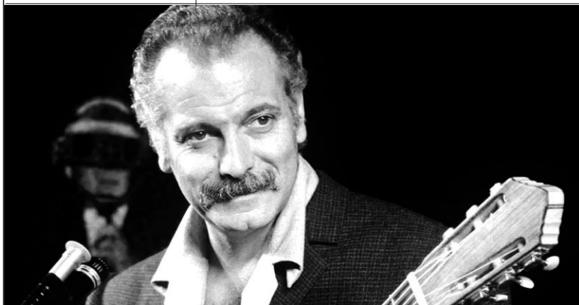
Georges Brassens, Chansonnier