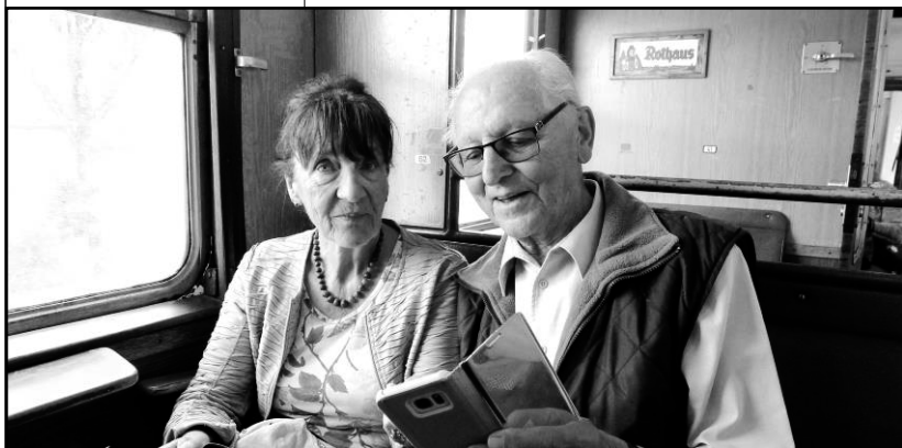
Stilleben in der Sauschwämmzlebahn