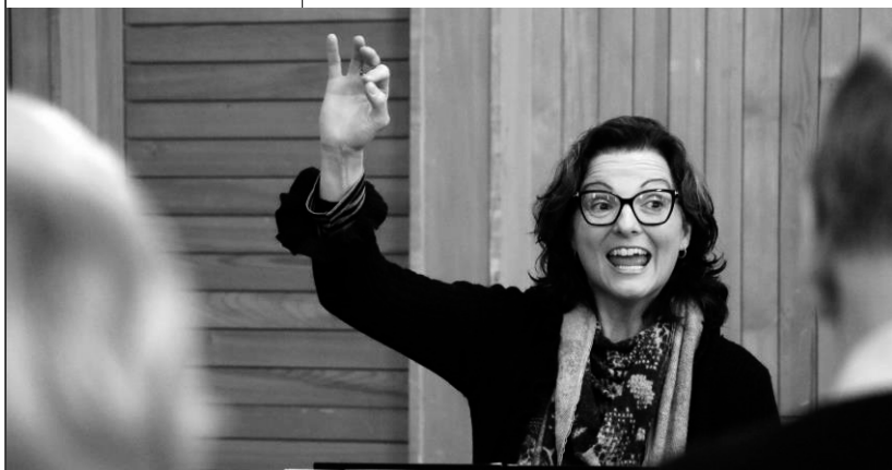
Da passiert was !