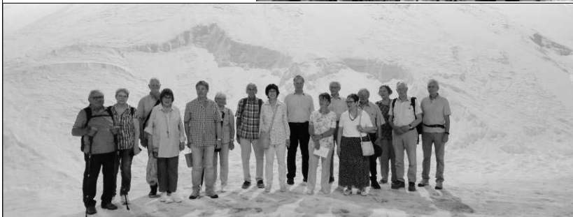
Im weissen Salzgebirge